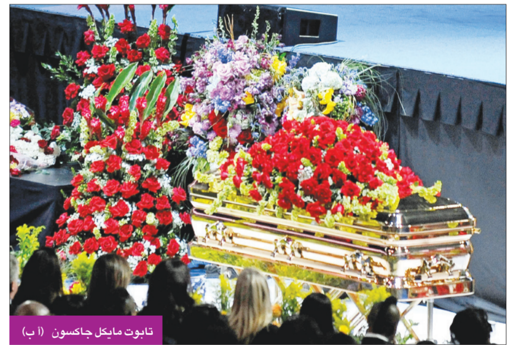
تابوت مايكل جاكسون

عائلته نقلت التابوت إلى «فورست لون» بعد التأين