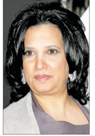
مي آل خليفة